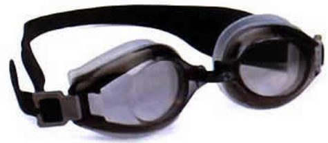
ドライアイに有効な眼鏡、ゴーグルの例 ( http://www.dryeyepain.com/Goggles.html )