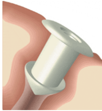
表面付近にとどまるタイプの涙点プラグ

いくつかの研究では、湿気を逃がさない眼鏡やゴーグル(水泳用のゴーグルに似たもの)を勧めています。それは眼のまわりの湿度を増加させ、涙液の蒸発を防ぎます。スポーツ時の風から眼を守るための眼鏡やゴーグルは、ドライアイ患者の涙液の乾燥を防ぐためにも使えます。水泳用ゴーグルは眼のまわりを完全にシールしていますので、同じように使うことができます。